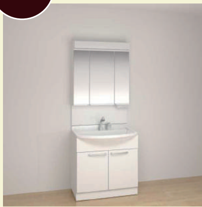
人造大理石 洗面ボウル くもりシャット、3面鏡