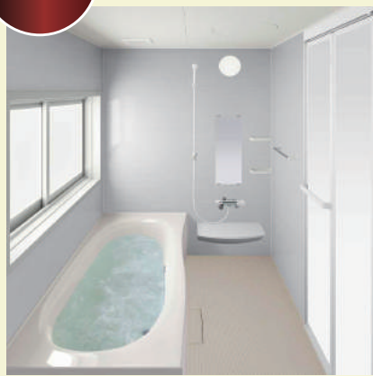
FRP 浴槽、スミピカフロア ささっと排水口