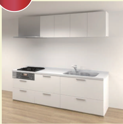
扉柄：VII0,VM10 シリーズ 人造大理石カウンター